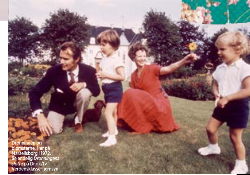
Dronningen og blomsterne. Her på Marselisborg i 1972. Se endelig Dronningens slotte på Dr.dk/tv. Verdensklasse-fjernsyn