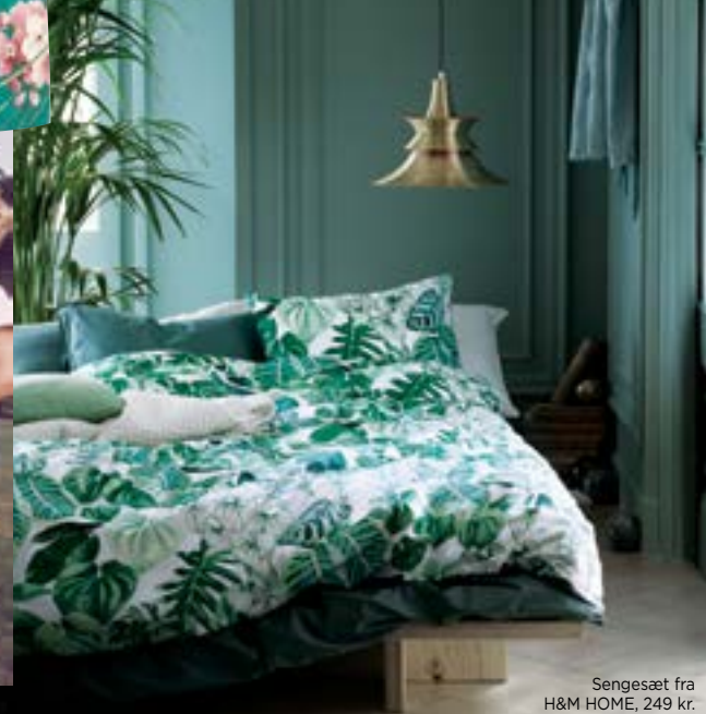
Sengesæt fra H&M HOME, 249 kr.

ment på blomster. Bloom- ons tre hollandske stiftere har nemlig gjort det til en levevej at sende buketter ud, altid i signaturstilen: høje, kulørte og mange arter i hver buket, men oftest kun med én blomst af hver. Blomsterne kom- mer direkte fra avlerne til dekoratørerne, så de er så friske som muligt. Det er sjovest med buketter, der varer mere end to dage.