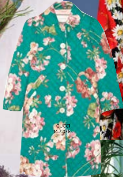
GUCCI 14.720 kr.