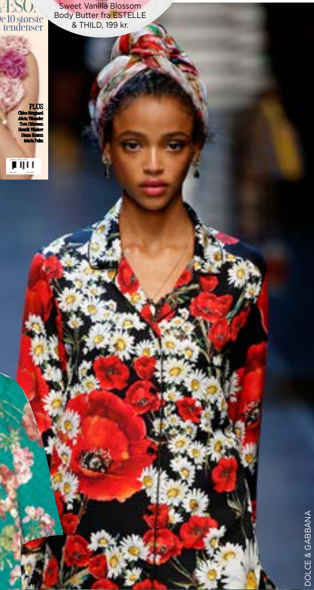
DOLCE & GABBANA