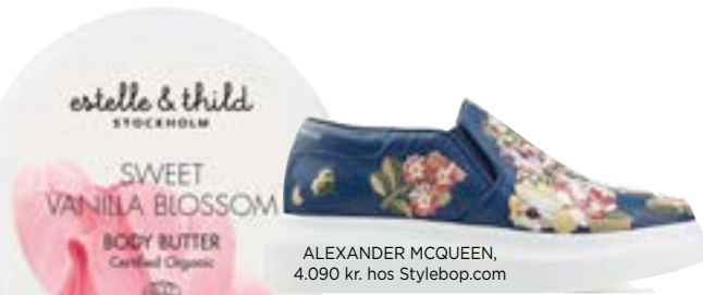
ALEXANDER MCQUEEN, 4.090 kr. hos Stylebop.com

estelle & thild STOCKHOLM SWEET VANILLA BLOSSOM BODY BUTTER Caribell Organic Sweet Vanilla Blossom Body Butter fra ESTELLE & THILD, 199 kr.